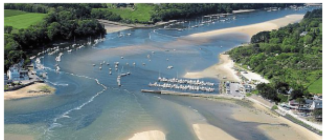
Guidel et ses sept kilomètres de littoral ont attiré 1 271 habitants en cinq ans.