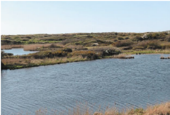
Les étangs du Loch