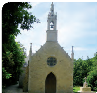
La Chapelle Notre Dame de Pitié (Guidel-Plages)