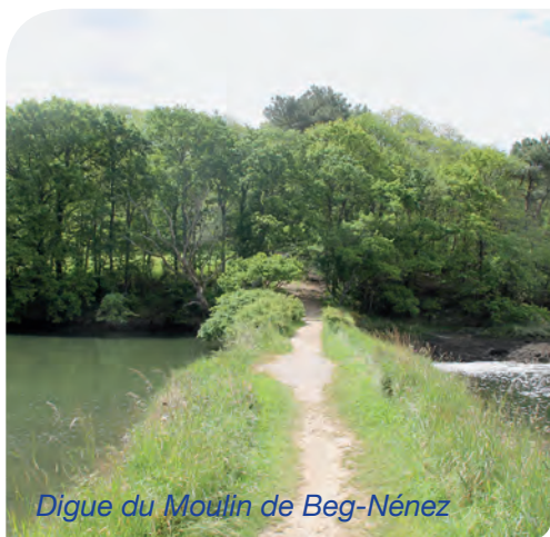
Digue du Moulin de Beg-Nénez

Seul moulin à marée implanté sur la commune de Guidel, le Moulin de Beg-Nénez a cessé de fonctionner en 1934.