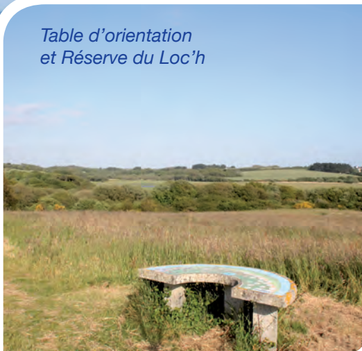
Table d'orientation et Réserve du Loc'h