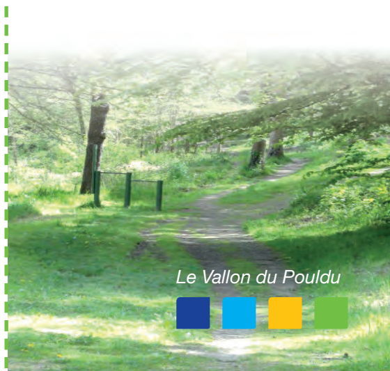
Le Vallon du Pouldu

Une mare temporaire se forme en aval lors d'épisodes pluvieux marqués. Une mare permanente est quant à elle visible au niveau de la source sud. »