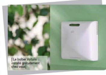
[Le boîtier Voltalis installé gratuitement chez vous]