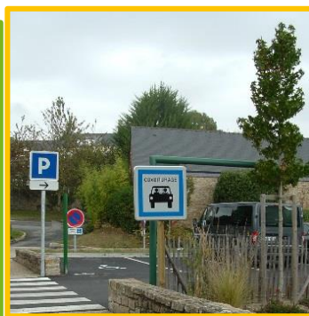
Aire de covoiturage L'ESTRAN Guidel-centre