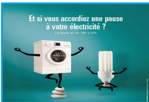
Campagne Ecowatt 2012