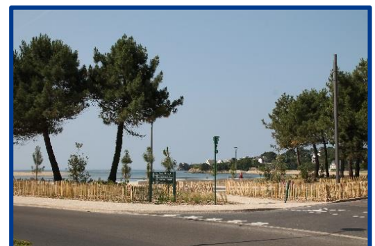
Aménagements de Guidel-Plages 2012-2013

Dossier établi à l'intention de la DREAL Bretagne Mission : promotion du Développement Durable