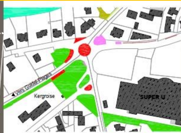
L'exemple du rond-point de la Porte de l'Océan, dit "du surfeur"

Chaque espace du domaine public identifié par l'inventaire a été transposé sur une cartographie. Reprenant les 15 catégories, celle-ci permet d'avoir soit une vision d'ensemble, soit une vue détaillée par type d'espaces. Elle démontre la variété des espaces verts, fleuris et naturels de la commune. À chaque type d'espace correspond un protocole d'entretien particulier, différent selon leur nature et leur usage. ■