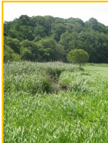
Etangs du Loc'h Réserve Naturelle Régionale, Espace Remarquable de Bretagne