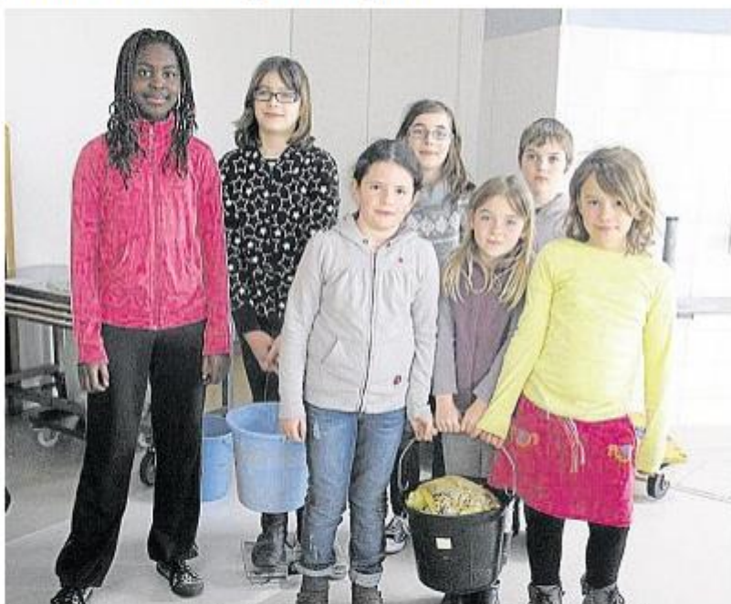
Pendant une semaine, toutes les écoles ont participé à la semaine anti-gaspillage.

Pendant une semaine, les élèves des trois cantines de Kerprat, Prat-Foën et Polignac ont recueilli et trié quotidiennement les déchets de leurs repas. Ils ont été pesés et les résultats affichés chaque jour. « Tous les élèves se sont sentis concernés et ont permis de réduire la quantité de déchets alimentaires de 15 % par rapport à une première pesée réalisée en janvier », précise Catherine Bodic. Ce sont quand même 90 kg de déchets qui ont été recueillis à la cantine de Kerprat (maternelle et