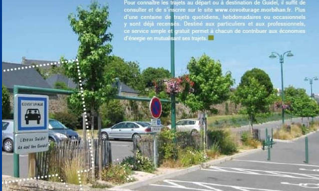
[Aire de covoiturage de l'ESTRAN]

Pour connaître les trajets au départ ou à destination de Guidel, il suffit de consulter et de s'inscrire sur le site www.covoiturage.morbihan.fr . Plus d'une centaine de trajets quotidiens, hebdomadaires ou occasionnels y sont déjà recensés. Destinés aux particuliers et aux professionnels, ce service simple et gratuit permet à chacun de contribuer aux économies d'énergie en mutualisant ses trajets.