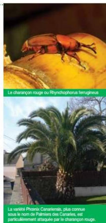
Le charançon rouge ou Rhynchophorus ferrugineus .