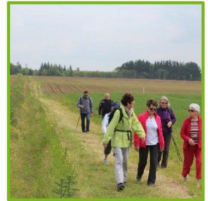
Ouverture du sentier "de Kerbastic à la Laïta"