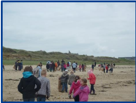
Nettoyage plage de Pen er Malo Mai 2012