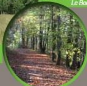
Vergers de Quéverne