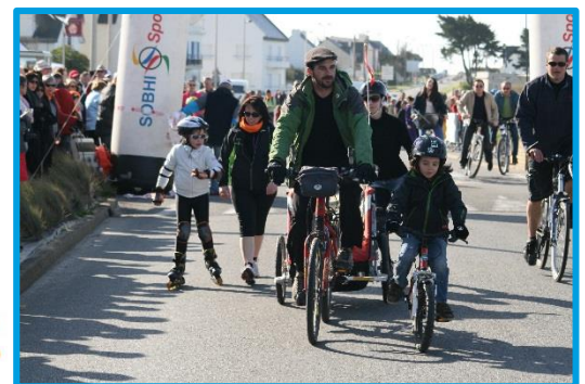
"LA LITTORALE 56" 21 Avril 2013