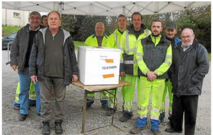
Les employés des espaces verts ont participé à l'opération et à la collecte pour le Téléthon.

« L'intérêt des Guidélois pour le jardinage au naturel et l'utilisation du compost végétal, devenu un véritable ami au fil des ans, ne leur font pas oublier leur générosité. Cette opération portée par l'Agenda 21 local et réalisée pendant la semaine de la réduction des déchets est un bon exemple d'une réutilisation massive des déchets verts d'une collectivité. »