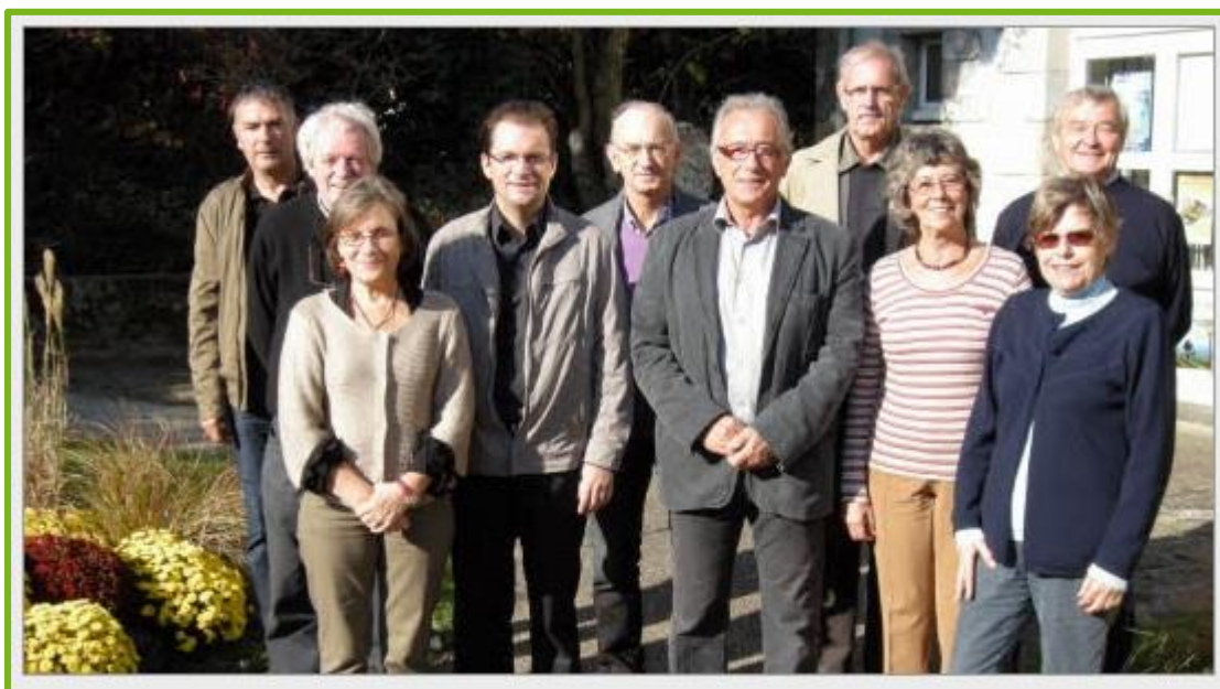
Une partie des membres de l'Observatoire de la Vie Locale

D'autre part, notre chargée de mission qui a eu l'occasion de se réunir avec les membres du réseau des chargés de mission développement durable de Bretagne, a participé à plusieurs groupes thématiques de l'Agglomération, à une journée sur la Stratégie Nationale de Développement Durable en 2012 à Rennes, a entretenu des contacts réguliers avec différents acteurs de la mise en œuvre d'Agenda 21 et de projets territoriaux ... et a suivi une formation spécifique sur la fonction de "relais local" dispensée par l'OF FEEE. Ces contacts réguliers nous ont enrichis et permis de percevoir la singularité de notre démarche (initiative portée par des élus et des agents municipaux et la population), que nous n'avons pas hésité à faire valoir dans diverses instances.