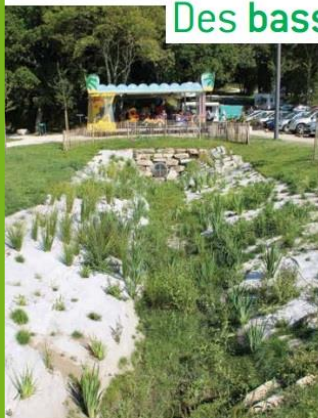
Progressivement, la végétation va s'installer sur l'ensemble du bassin et améliorera ainsi la dimension paysagère de cet espace.

Lors des récents aménagements des espaces publics de Guidel-Plages, deux bassins de phyto-épuration ont été réalisés. Perçus à tort comme une perte de place au détriment des parkings, ces nouveaux dispositifs d'assainissement des eaux pluviales mis en place avant l'été ont porté leurs premiers fruits, prouvant ainsi leur utilité dans l'amélioration de la qualité des eaux de baignade. Explications.