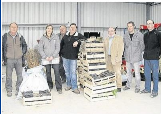
Mercredi, les propriétaires inscrits à Breizh Bocage ont reçu les plants à mettre en place dans les haies et les talus.

Inscrite dans l'Agenda 21 local, la mise en œuvre de Breizh Bocage vise plusieurs objectifs : l'amélioration de la qualité de l'eau, la préservation de la biodiversité et la restauration des paysages, la production de bois d'œuvre et de bois d'énergie et la lutte contre l'érosion des sols.