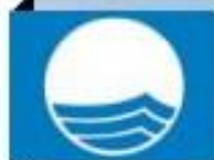
Plage de Pen er Malo

Cet été, les analyses quotidiennes de la qualité des eaux de baignade sont maintenues, tout comme le dispositif de gestion active pour la plage du Bas-Pouldu. Pour en savoir plus, n'hésitez pas à consulter le site www.guidel.com , rubrique Agenda 21. ■