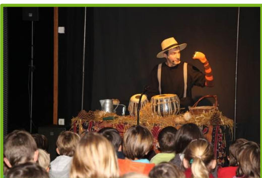
Spectacle "Lombric Fourchu" sur le compost et la réduction des déchets