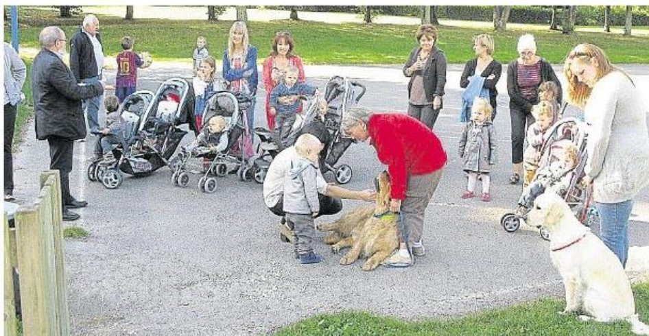
Les utilisateurs du parc Gauguin ont accueilli l'installation des distributeurs avec soulagement.

Pour cela, des distributeurs de sachets plastiques à utiliser pour ramasser ces déjections commencent à être installés dans divers endroits de la ville comme la place Jaffré, la place de Polignac, le Mail Léna, la rue Abbé-Coëffic, soit au total une dizaine d'endroits. « Quelques lieux particulièrement sensibles ont été aussi équipés de ces distributeurs, là où sont installés les jeux pour enfants et certains équipements sportifs ». C'est le cas à l'Espace Gauguin, à Guidel-Plages, sur les aires de jeux très fréquentées par les familles et les assistantes maternelles, ou près du sautoir de Prat-Foën utilisé pour les