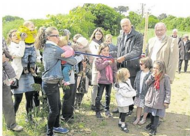
Ouverts le 25 mai dernier, les chemins de l'opération « Un arbre un enfant » font un peu plus d'1,2 km de longueur.

Autour du centre de Guidel, les jonctions entre Le Gouëric et la Trouée Verte constitueront le dernier maillon du « périphérique piétonnier » promis autour du bourg. « Cette réalisation pourrait donner lieu, en fin d'année, à une manifestation populaire au cours de laquelle les Guidélois seront invités à faire le Tro Kreizker Gwidel et à le