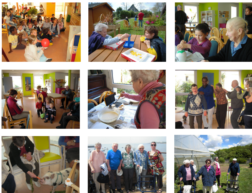
Service Communication - INPS - Janvier 2016

La MAPA de Guidel propose des animations variées : échanges intergénérationnels, rencontres pour maintenir les liens sociaux, sorties en minibus, ateliers santé (gymnastique douce).